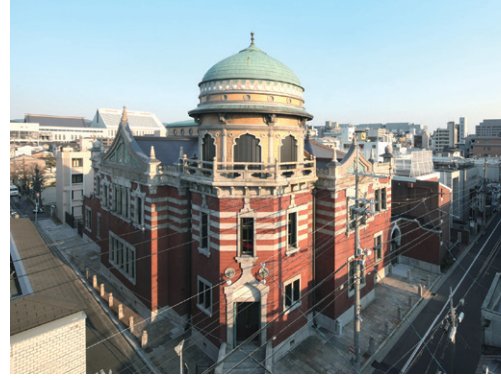
本願寺伝道院 | Hongwanji Dendoin

The exhibition introduces a wide range of works related to time, starting with works that evoke a universal concept of time, through to works exploring “memory” as something experienced individually, to “history” representing cultural phenomenon, as well as “traces” of time held by objects. By considering time not only in the usual manner as something relative, but also as something infinite that is beyond comprehensive, yet something finite that is within each of us, the exhibition asks how we can respect one another and coexist in the time — limited and impartial — we are living today.