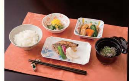
セレクト昼食 A (和食)