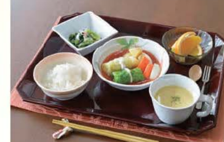
セレクト昼食 B (洋食)

現地調理にこだわった食事を提供いたします。「温かいものは温かく、冷たいものは冷たく」を大切にご満足いただける食事をご用意いたします。昼食の主菜については、安心・安全な食材を使った栄養バランスのとれたおいしい料理を2種類のメニューからお選びいただけます。バランスの良い食事を、入居されている方々と一緒にとることで、よりいっそう楽しい日常生活をお過ごしいただくことができます。