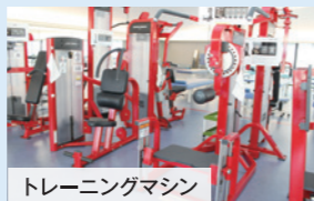
トレーニングマシン