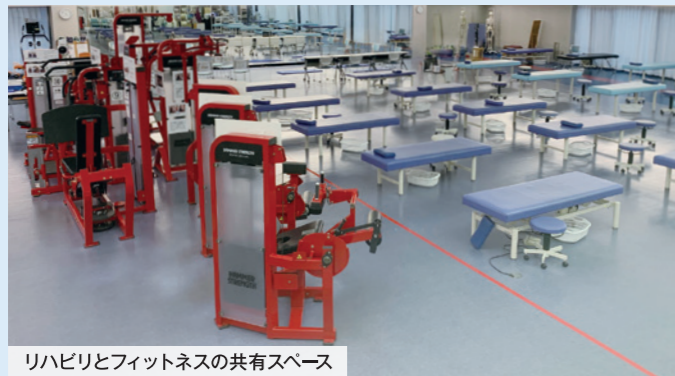
リハビリとフィットネスの共有スペース