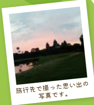
旅行先で撮った思い出の写真です。