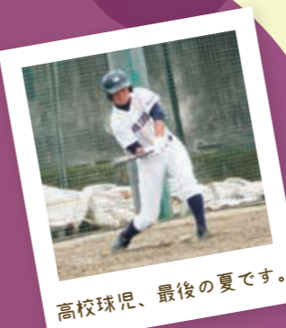
高校球児、最後の夏です。