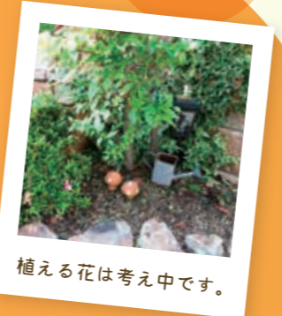
植える花は考え中です。