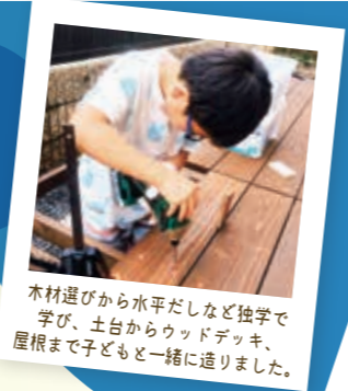
木材選びから水平だしなど独学で学び、土台からウッドデッキ、屋根まで子どもと一緒に造りました。