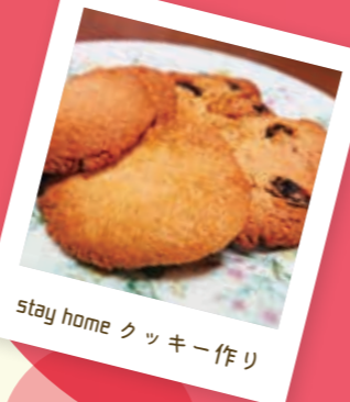
stay home クッキー作り