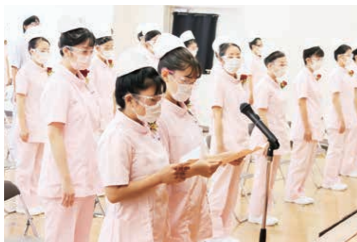
▲ 代表生徒あいさつ