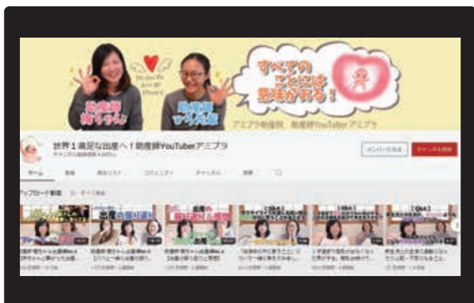
〈チャンネル名〉 「世界1満足な出産へ！助産師YouTuberアミプラ」