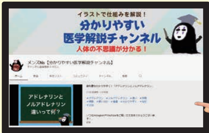
〈チャンネル名〉 メンズNs【わかりやすい医学解説チャンネル】

いまどきの学生はYouTubeで勉強する？ YouTubeを使いこなす学生がおすすめの YouTubeチャンネルをご紹介します！