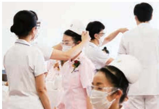
▲ ナースキャップ受け取りの様子