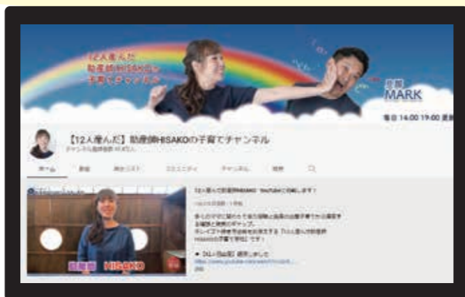
〈チャンネル名〉 【12人産んだ】助産師HISAKOの子育てチャンネル