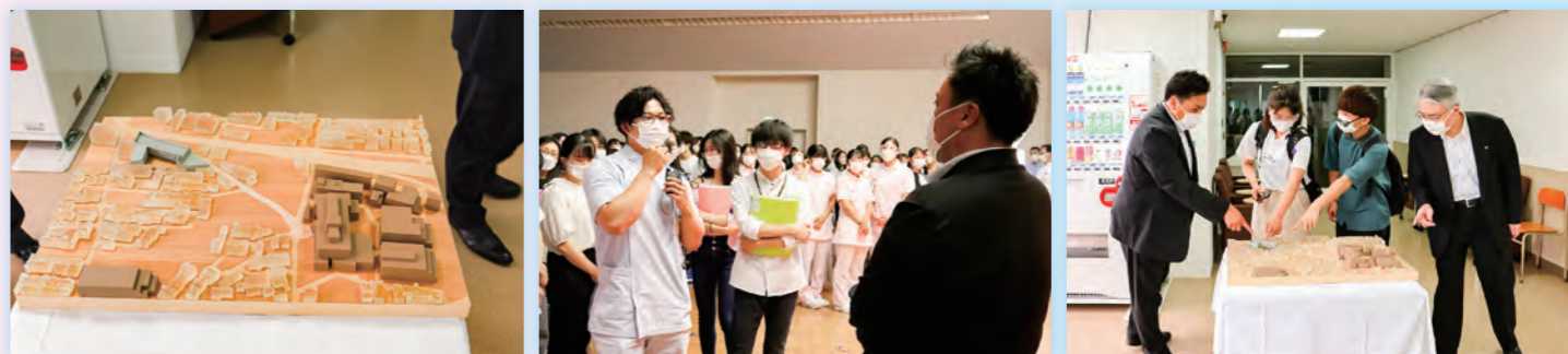
▲ 設計を手掛けるのは、HOSOO architecture代表で、一級建築士の細尾直久氏