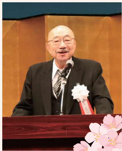
※役職は2024年3月4日現在のものです