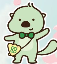
洛和会ヘルスケアシステム 公式キャラクター らくの助