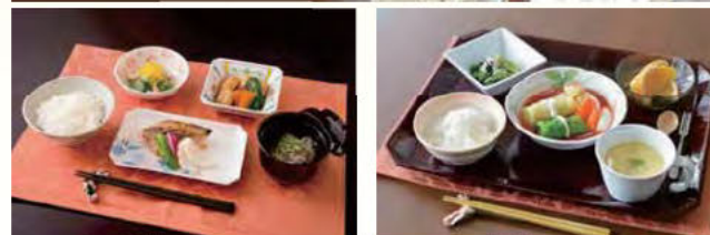
セレクト昼食 A (和食)