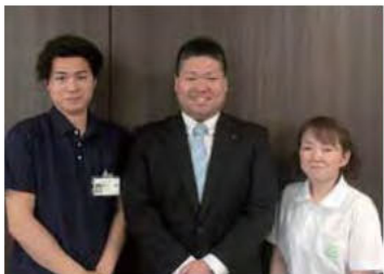
写真左から理学療法士・施設長・看護師