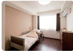
居室（モデルルーム）

洛和ホームライフ北野白梅町は、京都市営バス「大將軍」停留所から徒歩3分の利便性の高い場所に立地しております。洛和会丸太町病院へもバスで6分程度（4停留所）と通院もしやすくなっております。また、周辺には「北野天満宮」や「平野神社」などの名所もあり、「京都駅」や「四条河原町」へのバスの便数も多く、利用者さまはもちろん、ご家族にもお楽しみいただける、四季折々の風情がございます。