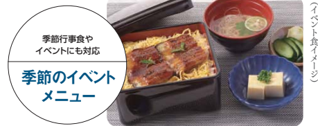
（イベント食イメージ）