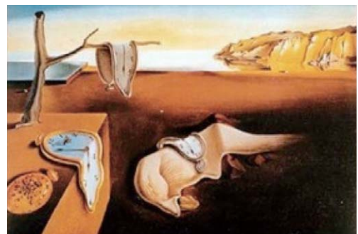
「記憶の固執」サルバドール・ダリ http://matome.naver.jp/odai/2126265947427696701?page=2 より