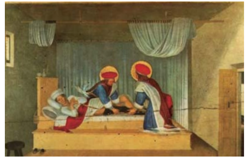
「The Healing of Justinian by Saint Cosmas and Saint Damian」フラ・アンジェリコ