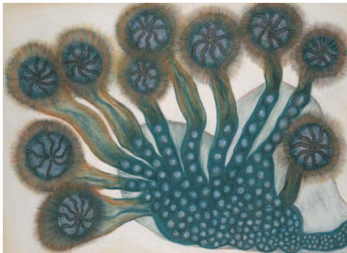
「水の花」 アンナ・ゼマンコヴァー