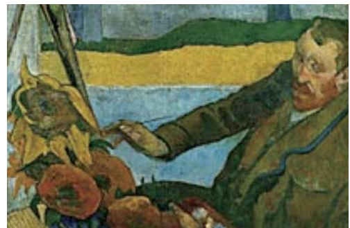
「ひまわりを描くフィンセント・ファン・ゴッホ」ポール・ゴーギャン 1888年