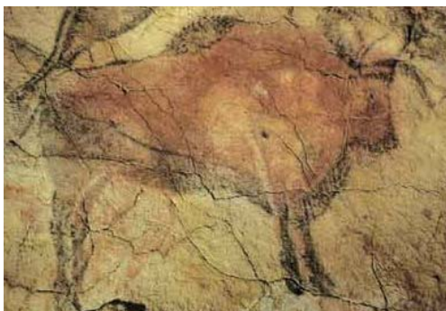
「アルタミラ洞窟壁画」 http://www.eonet.ne.jp/~wukkynomori/nenpyou/image/altamira.jpg より