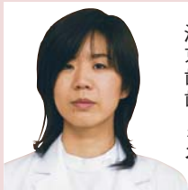
洛和会音羽病院 京都口腔健康センター 歯科麻酔科 部長 歯科医師