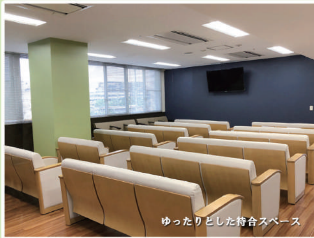
ゆったりとした待合スペース