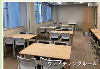
ウェイトングルーム