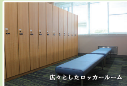
広々としたロッカールーム