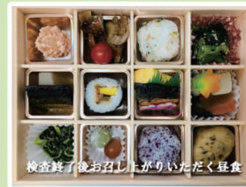
検査終了後お召し上がりいただく昼食