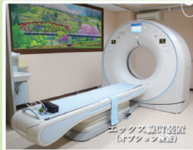
エックス線撮影装置 (オプション検査)