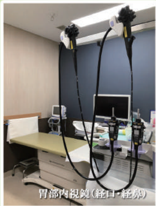
胃部内視鏡(経口・経鼻)