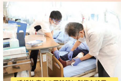
透析治療中の回診時に創傷を処置