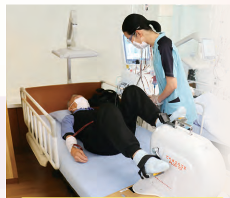
患者さんの状態に応じた筋力トレーニングを実施