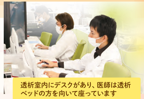
透析室内にデスクがあり、医師は透析 ベッドの方を向いて座っています