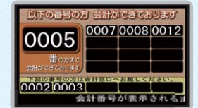
会計案内表示機の画面