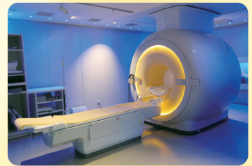
Philips社製 Ingenia1.5T CX

スピネコー系の拡散強調画像の撮像による脳底部の新鮮梗塞の評価、全身拡散強調画像によるPET検査のようなMRI画像の撮像(DWI ドワイブス B)による悪性腫瘍の評価、これまで評価するのが難しかったTFCC(三角線維軟骨複合体損傷)、指関節の評価、現有の3.0テスラの装置では描出に難のある主静脈の情報など、いろいろと評価に耐える画像が提供できると確信しております。通常の画像もかなり信頼できるものを提供できると考えておりますので、ご質問などございましたら、まずはお気軽にお問い合わせください。