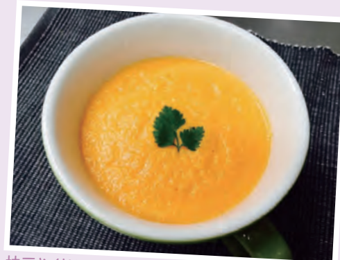
枝豆やグリーンアスパラ、カボチャなど食材を変えてもおいしくいただけます。