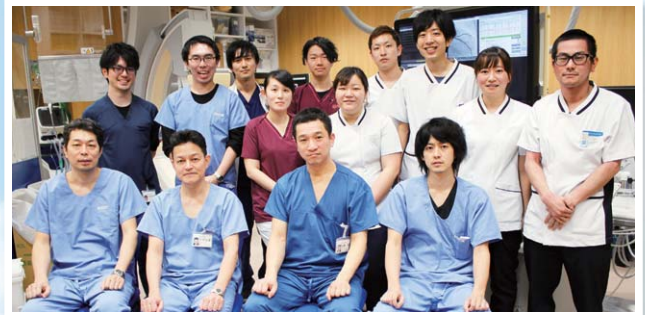
心カテチーム集合写真