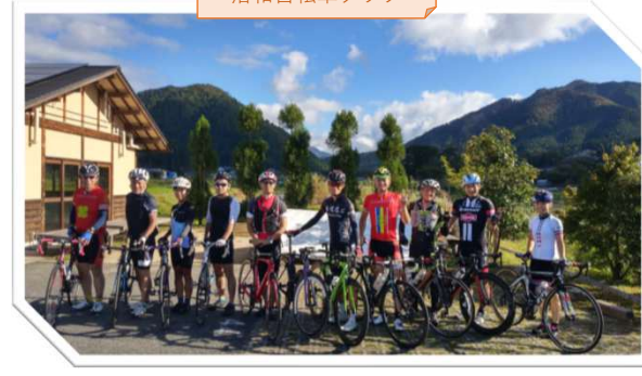
洛和自転車クラブ