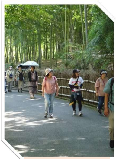
らくらくワングル倶楽部 (ヘルスツーリズム)