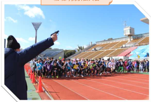
職域対抗駅伝大会