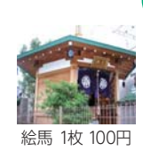
絵馬 1枚 100円