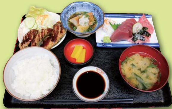
▲再来定食 1,000円(税込み) (中トロ、赤身造り、マグロフライ、一品)