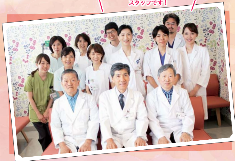
洛和会音羽病院 産婦人科・総合女性医学健康センターのスタッフです！