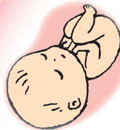
今号でシリーズ最終

妊娠初期の胎盤が形成されるときに、何らかの原因で胎盤形成が障害されると血流が少なくなります。妊娠後期になると赤ちゃんは多くの酸素や栄養を必要とするようになりますが、形成が不十分な胎盤は、血流低下により赤ちゃんに十分な栄養を届けられなくなります。その時、胎盤は酸素不足によるストレスでいろいろな物質を分泌し、母体の全身血管に作用し、子宮への血流（酸素供給）を増やすために血圧を上げようとします。この状態を 妊娠高血圧症候群 と言います。