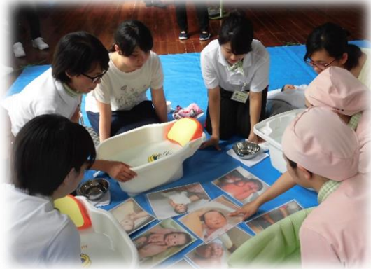
赤ちゃんってお風呂が好きなんだ!

『妊娠』『妊婦の日常生活』『育児』『沐浴』を洛和会京都厚生学校助産学科学生から学びました。