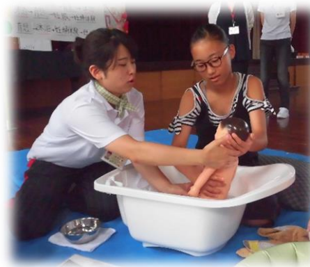
支えることが難しい!