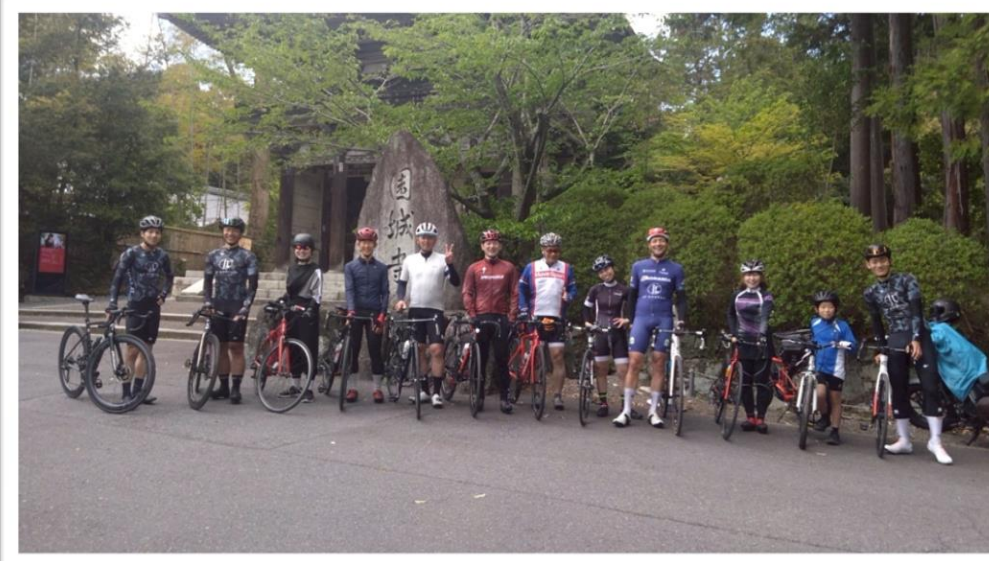
洛和自転車クラブ