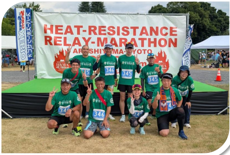
ランナーズクラブ