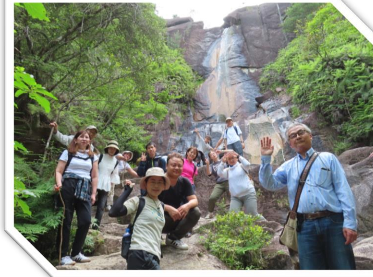
らくらくワングル倶楽部 (ヘルスツーリズム)