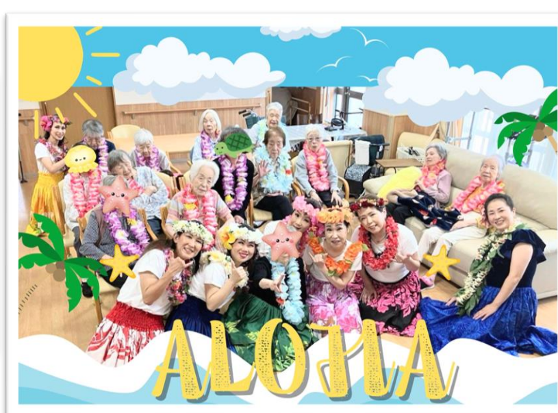
フラダンスクラブ