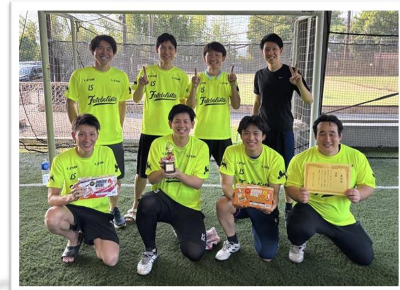
洛和会マドリッド